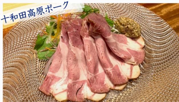
桃豚ローストポーク 900円