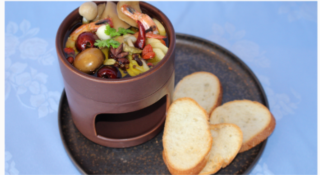
海老とキノコのアヒージョ 900円 バケット付き