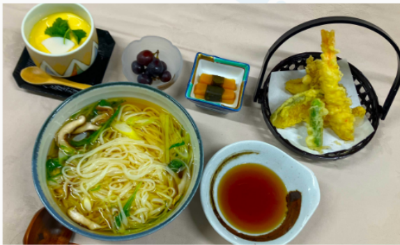
天婦羅稲庭うどん御膳 (温) 1,800円 茶碗蒸し・お新香・フルーツ付き