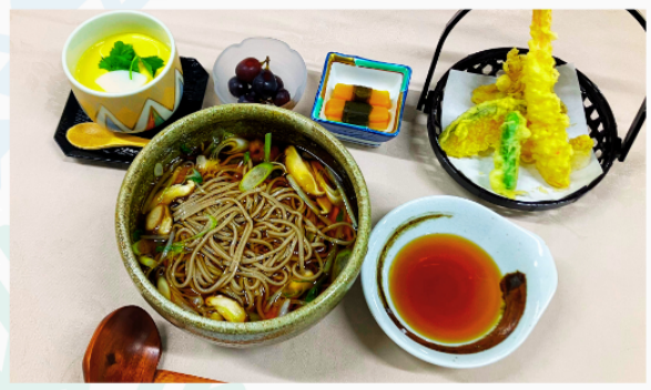
天婦羅そば御膳 (温) 1,600円 茶碗蒸し・お新香・フルーツ付き