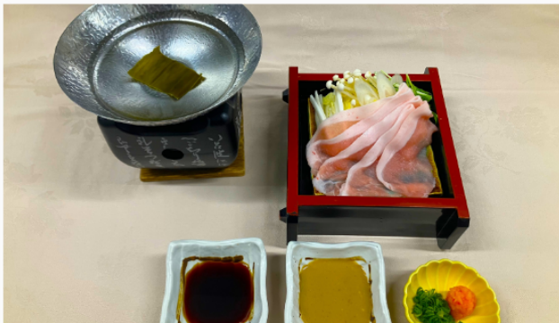
桃豚のしゃぶしゃぶ 単品 1,200円