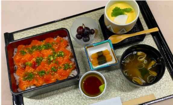
サーモン重 1,600円 茶碗蒸し・お新香・フルーツ付き