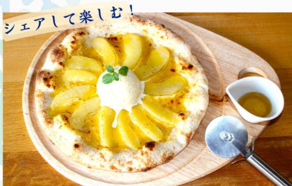
リンゴのデザートピザ