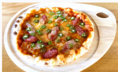
チョリソーとハラペーニョのピッツァ