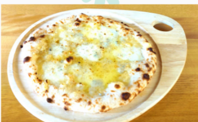
クワトロフォルマッジョ