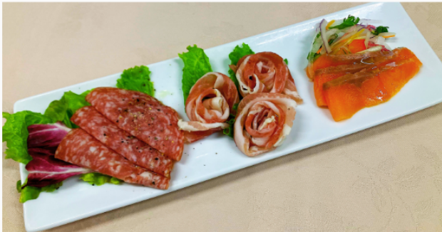
生ハム・ミラノサラミ スモークサーモンの盛り合わせ 1,200円