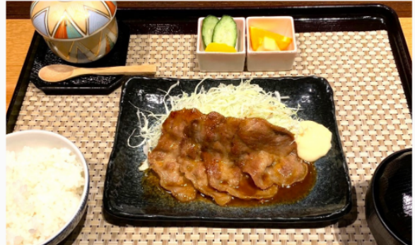
桃豚の生姜焼き定食 1,300円 茶碗蒸し・お新香・フルーツ付き