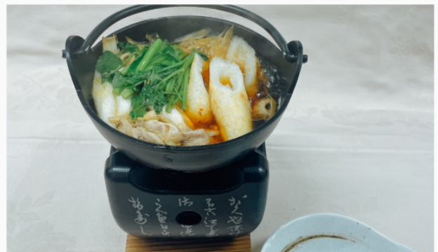
きりたんぼ鍋 単品 1,100円