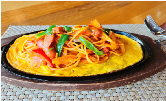
鉄板焼きナポリタン 1,200円