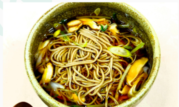
そば (温) 単品 1,000円