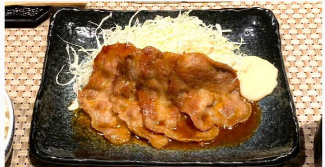
桃豚の生姜焼き 単品 1,000円