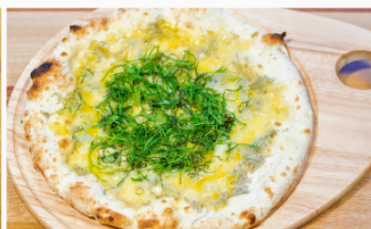
シラスと葱のピッツァ