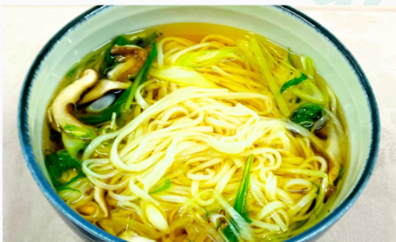
稲庭うどん (温) 単品 1,200円