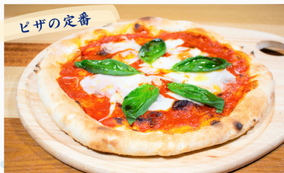
ピッツァ・マルゲリータ