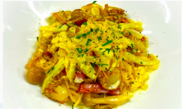
帆立と冬野菜の 柚子クリームスパゲティ 1,200円