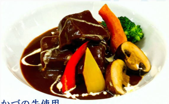
かづの牛使用 柔らかお肉の ビーフシチュー 1,500円