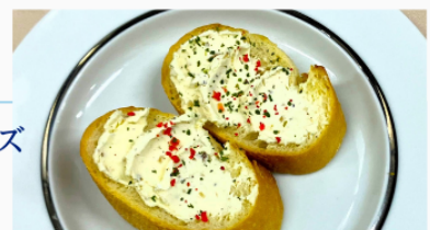
いぶりがっこクリームチーズ のブルスケッタ 600円