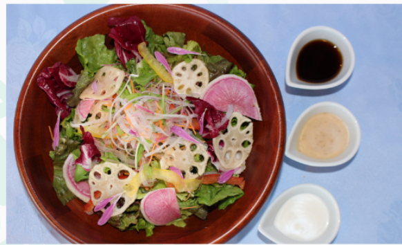
気まぐれサラダ 800円