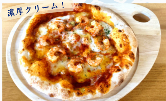
海老のトマトクリームピッツァ